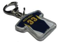
ユニホーム型キーホルダー