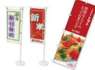
のぼり・ミニのぼり旗