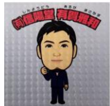
似顔絵作成・特殊紙印刷